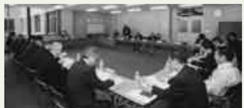
H19.1.31 開催の第2回国民保護協議会の様子