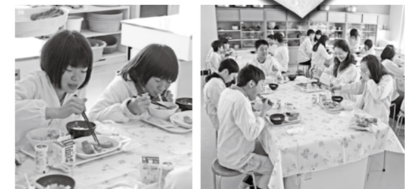
■卒業を前に「バイキング給食」を楽しむ中村小6年生