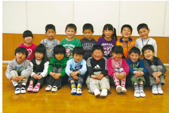
久賀幼稚園 ゆりぐみ(5歳児) 『すすめ!おもいでれっしや 久賀小学校へレッツゴー!!』