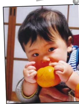
伊藤 れんちゃん H22年3月12日生まれ 〔西谷〕 「今年は、お友達のワンコ達と歩いて一緒にお散歩したいなあ♪」