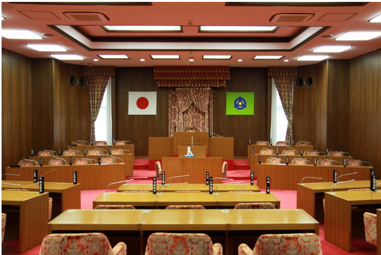
多古町議会の議場

なお、議長を助け、議長が病気などでいない時など、かわりに仕事をする人を副議長といいます。副議長も議会議員の中から選ばれます。つまり議長は児童会・生徒会の会長、副議長は副会長と同じですね。