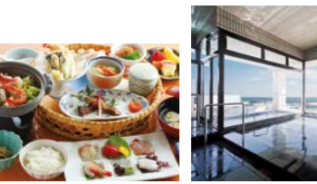
【銚子ぎょうけい館】明治7年の創業時より多くの文人・貴顕に愛される旅館でお風呂に入って小休憩。食事はもちろん多古米ごはんも新鮮な海の幸