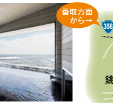
【銚子ぎょうけい館】明治7年の創業時より多くの文人・貴顕に愛される旅館でお風呂に入って小休憩。食事はもちろん多古米ごはんも新鮮な海の幸