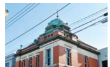
【三菱館】明治13年に銀行として建設された県内有数の洋風建築