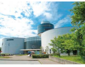
【航空科学博物館】日本最初の航空専門の博物館