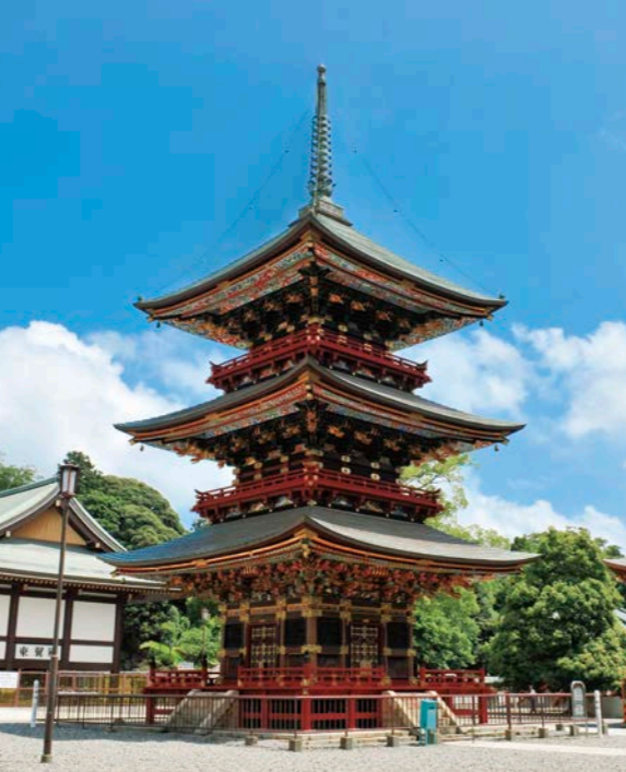
【成田山新勝寺】年間約一千万人の参詣者が訪れる成田山新勝寺。参道に足を伸ばして門前町の雰囲気味わうのもいい