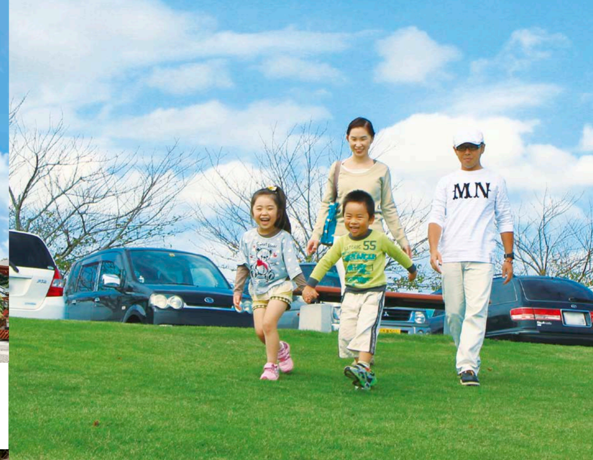
【道の駅多古あじさい館・あじさい公園】駐車場やトイレが整備された道の駅はドライブには必須の中継ポイント。四季折々の景観が楽しみ、食事や特産品・惣菜も多古町ならではの食材を使ったものが豊富に揃う

【多古・成田編】見て買って食べて、多古の自然の恵みを存分に味わえる上に、成田山新勝寺の参拝者や成田国際空港の旅行者でにぎわう成田市も巡る盛りだくさんのドライブコースです。