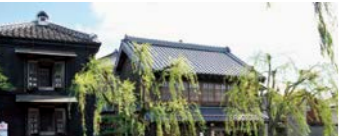
【佐原の町並み】江戸情緒あふれる国選定の重要伝統的建造物群保存地区