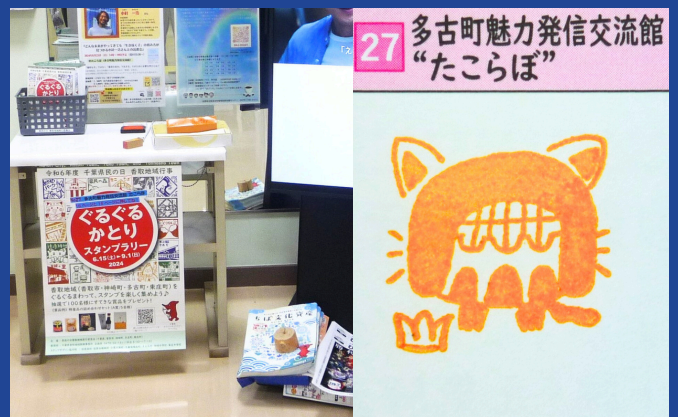
27 多古町魅力発信交流館 “たこらぼ”

6月15日の「県民の日」を記念して、「ぐるぐるかとりスタンプラリー」（県民の日香取地域実行委員会主催）を開催中です。専用の台紙に香取地域一市三町の20か所に設置されたスタンプを集めて応募すると抽選で香取地域の特産品等が当たります。「たこらぼ」にもスタンプが置いてありますので、スタンプゲットにいらしてみてもはいかがでしょうか。