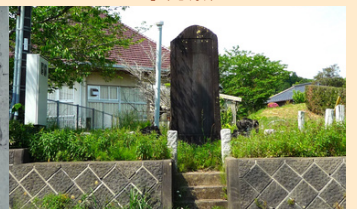
バス運行10周年記念碑

たこらぼハロウィンWEEKを行います！ 続報はSNS・HP等に掲載します。お楽しみに♪