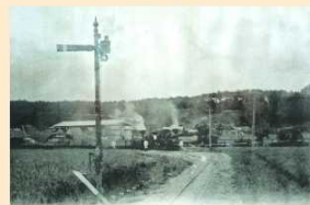
多古駅 栗山川貨物ホーム