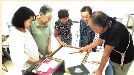
打ち合わせ中の「造形あそび」のメンバー