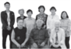
NPO 法人 観光・交流・助け 合いネット多古の 皆さん

子どもから高齢者までの各世代が楽しみ集える場を創り、地域交流の活性化を図ります。