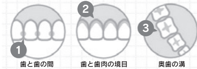
3大プラークゾーン

現在では、毎日歯を磨く人の割合は95%にも達し、しかも1日に2回以上磨く人はなんと60%近くもいるそうです。それなのにどうして歯周病になる人が多いのでしょうか？おそらく、歯は磨いているけれども歯周病を予防できるほどには磨けていない、つまり効果的な歯磨きには至っていないということが原因だろうと考えられます。