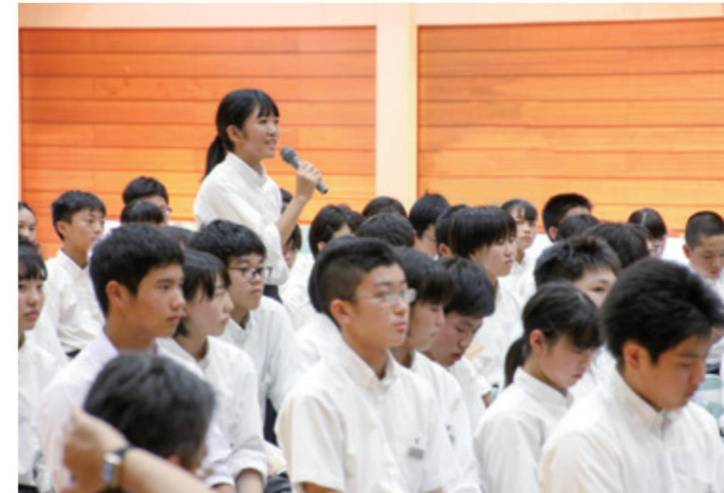
質問を投げかける生徒

多古中全校生徒が夢について考える道セミナー。 航空業界の講師の話聞いて、生徒たちは何を感じ、そして何を考えたでしょうか。