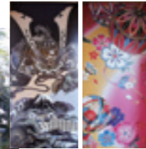
トイレ入り口の表示や和柄デザインの壁画が特徴的