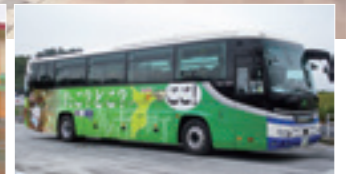
第1弾JRバス関東高速バス