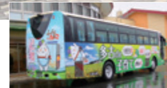
第2弾千葉交通高速バス