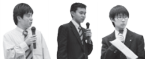
グループワークで出た意見を発表する多古高生