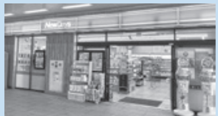
「NewDays 成田店」(JR成田駅改札外)

JR成田駅のコンビニエンスストア「NewDays」で「お米の町の天然水 多古水」を販売中です。 足をお運びの際は、ぜひお立ち寄りいただき、「多古水」をお探しくささい。