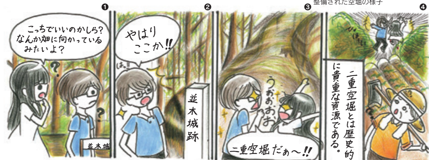
広報係 石毛穂乃佳 作