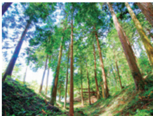
整備された空堀の様子