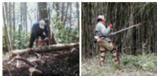
生い茂る草木を整備し、城郭が姿を現した。