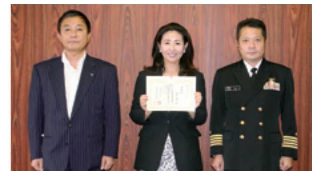
(左から) 所町長、野老さん、大山千葉地方協力本部長