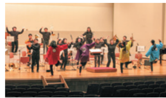
多古高校吹奏楽部演奏