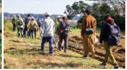
健康ウォーキングで志摩城跡からの移動