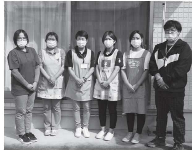
総勢 18名のスタッフでサポートしています

高齢になっても、介護が必要になっても住み慣れた多古町で暮らしたい。第6回は、介護が必要になった高齢者の暮らしをサポートする小規模多機能型居宅介護を行う「ルミナスおたがいさま」を紹介します。