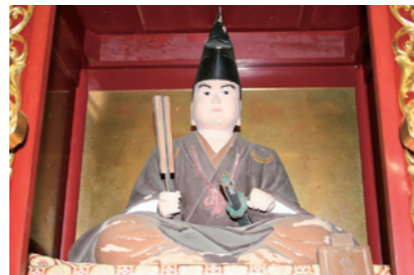
佐賀県小城市光勝寺に祭られている千葉胤貞像