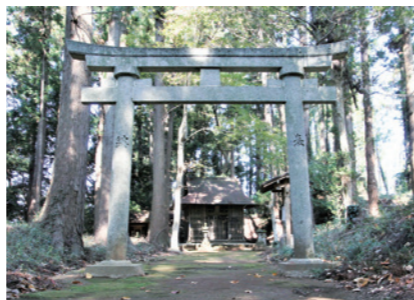
分城跡にある妙見神社