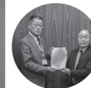
要望実現のため町に協力要請