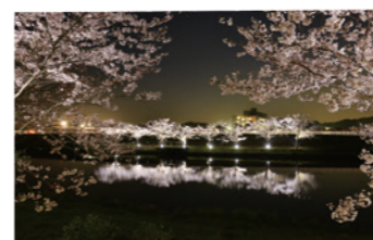
昨年度実施フォトコンテスト最優秀賞作品