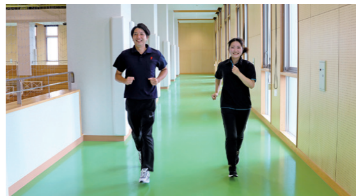
2階のギャラリーは通路が広めで走りやすくなっています