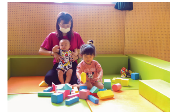
お子さんと一緒に楽しくご利用ください