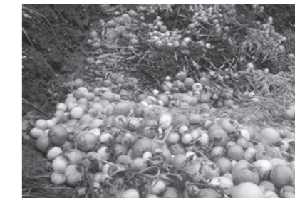
放置された農作物