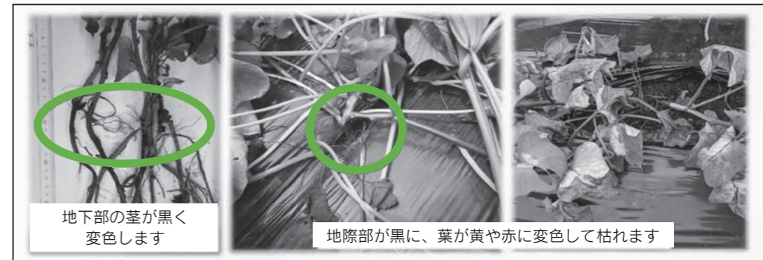
地下部の茎が黒く変色します