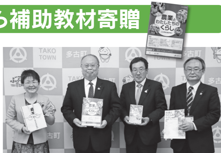
(左から) 木川教育長、JAかとり武田代表理事組合長、JAかとり掛巣常務理事、JAかとり朝日金融部長