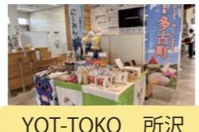
YOT-TOKO 所沢 6月17日