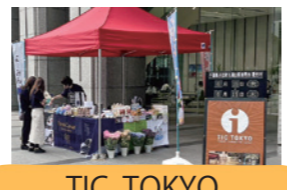
TIC TOKYO 6月15日