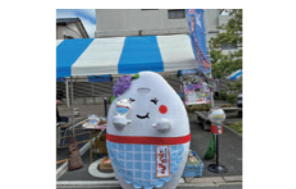
ご当地キャラ成田詣 5月20日、21日