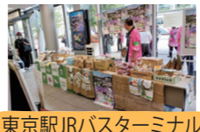
東京駅JRバスターミナル 5月6日

2多古町をPRするため、5月・6月に1都 ふつくらたまごさんと一緒に参加した「ご 当地キャラ成田詣」では、うなりくんと一緒に にステイジに出たり、町のパンフレットを配 布したり、同時に行った物販では、多古町の配 特産品(多古米・野菜)や和菓子、あじさい や御城印などを販売したりと、多古町の魅力 をたくさんの方にPRできました。