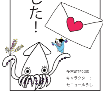
多古町非公募キャラクター：セニョールらし