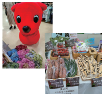
ちば文化資産(そごう千葉店) 6月15日

2多古町をPRするため、5月・6月に1都 ふつくらたまごさんと一緒に参加した「ご 当地キャラ成田詣」では、うなりくんと一緒に にステイジに出たり、町のパンフレットを配 布したり、同時に行った物販では、多古町の配 特産品(多古米・野菜)や和菓子、あじさい や御城印などを販売したりと、多古町の魅力 をたくさんの方にPRできました。