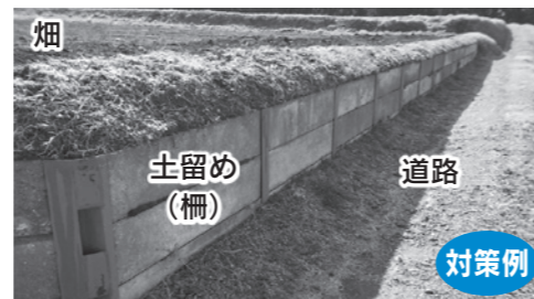
法面に土留め(柵)を設置