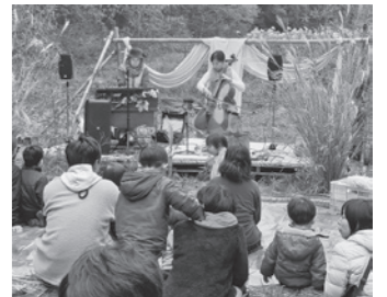
令和5年度採択事業の様子