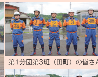
第1分団第3班(田町)の皆さん