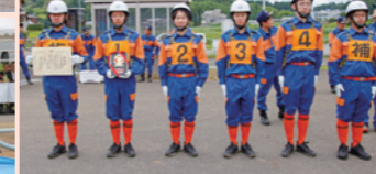
第4分遣所(飯笹)の皆さん