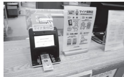
マイナ保険証の読み取り機 ※医療機関によって機種は異なります。