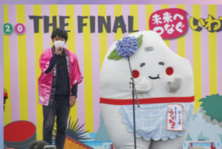
令和 2 年(2020 年)に岩手県で開催された「ゆるキャラグランプリ 2020 THE FINAL」では、全国第 8 位・千葉県第 1 位に輝きました。