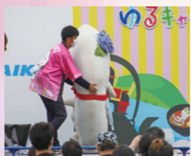
たまこさん今よりもちょっとスマート？

皆さんいつも応援ありがとうね！ これからもいろんなところに行くから、私を見かけたら声をかけてね！ うふふ♪