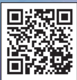
ふっくらたまこ 公式エックスはこちら